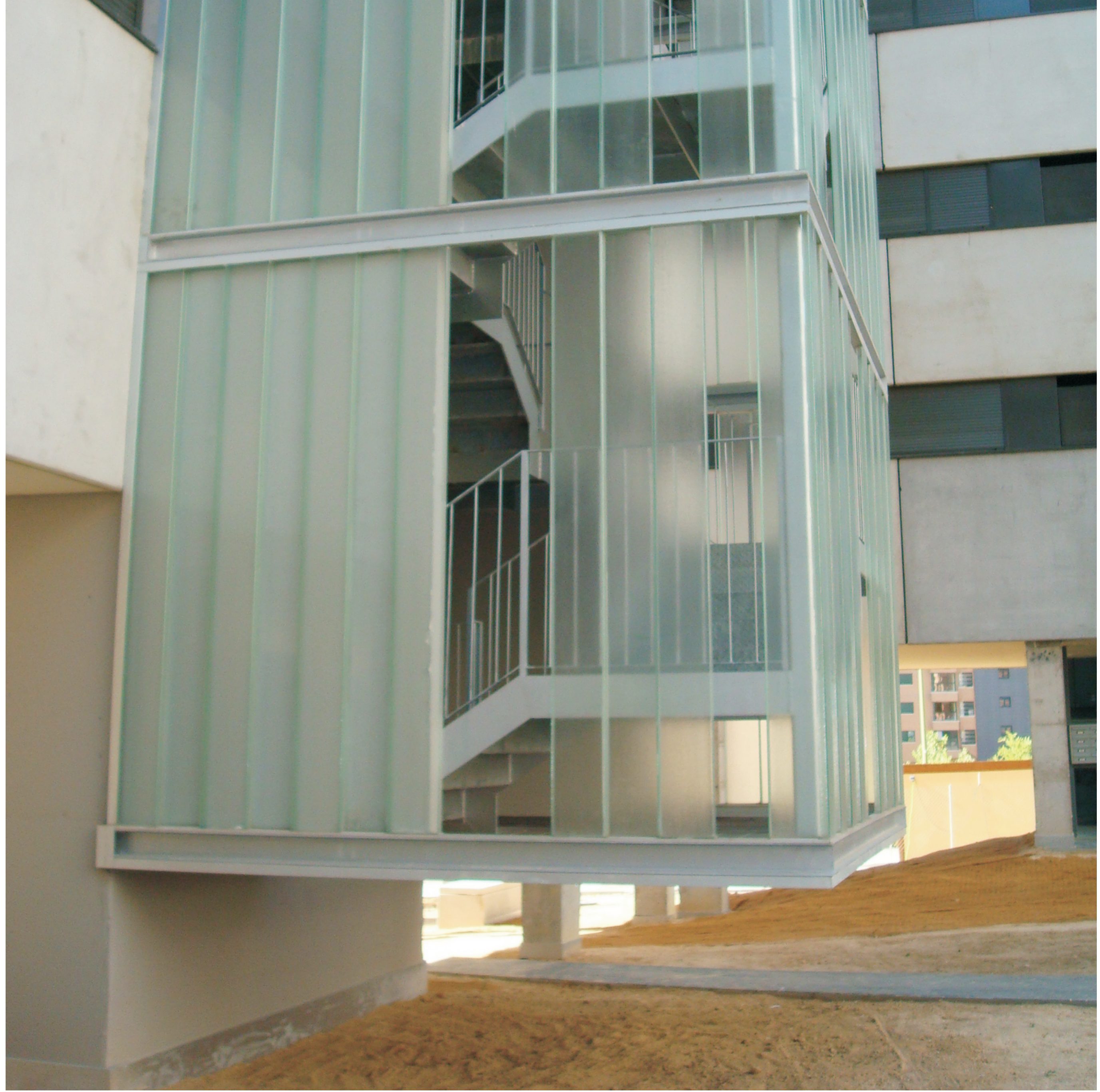
1. Interior de vivienda 2. Interior de la manzana 3. Detalle de fachada 4. Núcleo de comunicación en vidrio u-glass